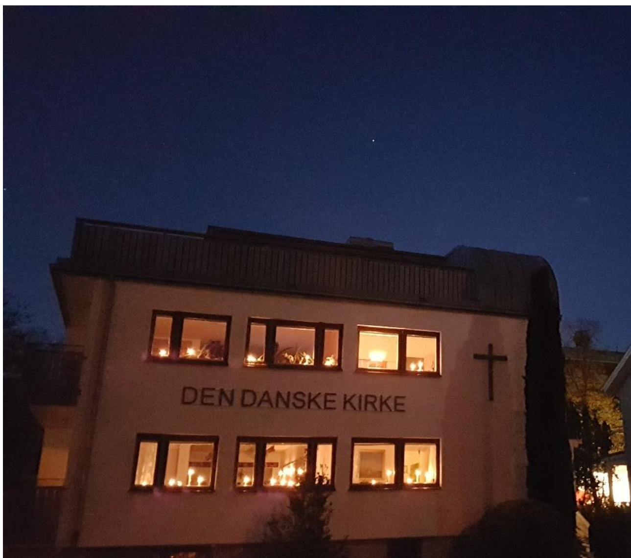
Foto fra aftenen d. 4. maj, hvor 75året for proklamationen af Danmarks befrielse blev markeret i kirken med levende lys i alle vinduer.