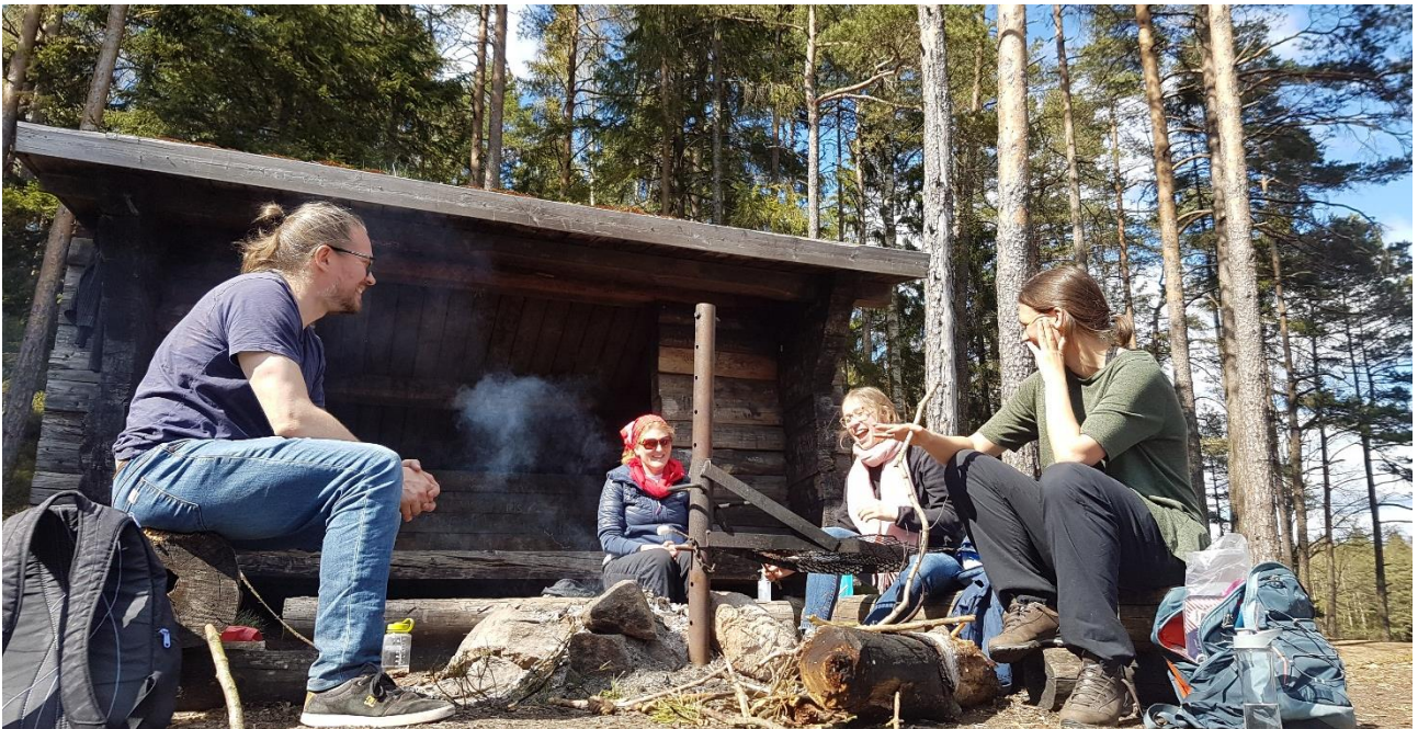
Foto fra vandreturen i Vättlefjäll med ungdomsassistenten længst til højre.

Ung i Göteborg har allerede været på en kort vandretur i Vättlefjäll med en gruppe på fem.